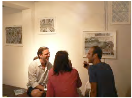
soirée à café au lit, exposition de Gabriele Basch, 2006

Une exposition d'art, c'est une montage d'expériences . Elle est favorable à la pensée tout en empruntant les chemins du sensuel. Elle parle toujours de sa production ainsi que des réflexions ayant mener à sa réalisation. Une exposition c'est aussi une tête-à-tête entre l'œuvre et le visiteur.